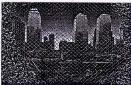
Константин Худяков. Без названия

Из 200 с лишним претендентов к участию в нынешней «Арт-Москве» допущены всего 45