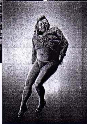
Дэвид Лашапелль. «Пробуждение Абигали», 2007 год